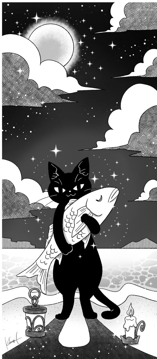
illustration: kohagi chihara

碧乃そら @hane_a022 青野佑季 @book_aoinusyoku 麻数 @umberhemp 麻倉ゆえ @AsakuraYue 有村栞 @chattenoire_k 井倉りつ @ura_litz 石川順一 @Hitler57 宇井モナシ @kijousan 宇祖田都子 @Shinmyutu2020 泳二 @Ejshimada hs @hswelt